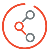
SISTEMISTICA E INFRASTRUTTURE IT

Il Focus. Un unico referente per tutte le tue esigenze informatiche.