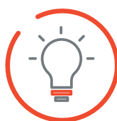
GRAFICA E COMUNICAZIONE