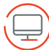
SVILUPPO SITI WEB ED E-COMMERCE