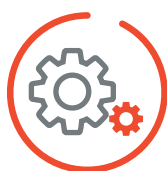
SVILUPPO SOFTWARE PERSONALIZZATI